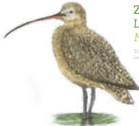
Zarapito pico largo Long-billed curlew Numenius americanus