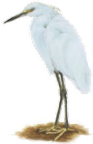
Garza nivea Snowy egret Egretta thula

Tomado de "Guía rápida de las aves comunes de Guerrero Negro, BCS"