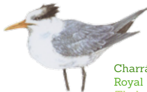
Charrán real Royal tern Thalasseus maximus