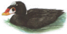
Negrón costero Surf scoter Melanitta perspicillata