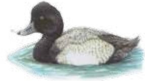
Pato boludo menor Lesser scaup Aythya affinis

Tomado de "Guía rápida de las aves comunes de Guerrero Negro, BCS"