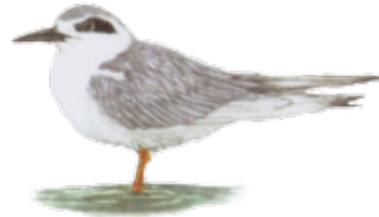
Charrán de Forster Forster's tern Sterna forsteri