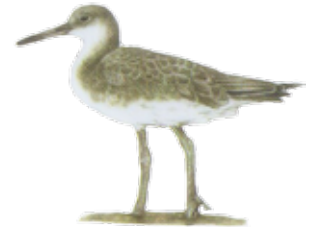
Playero pihuihuí Willet Tringa semipalmata