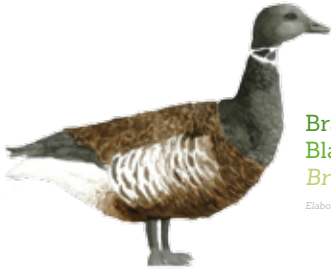
Branta negra Black brant Branta bernicla nigricans