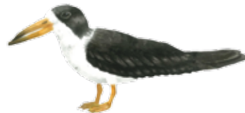
Rayador americano Black skimmer Rynchops niger

Tomado de "Guía rápida de las aves comunes de Guerrero Negro, BCS"