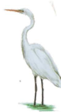
Garza blanca Great egret Ardea alba

Tomado de "Guía rápida de las aves comunes de Guerrero Negro, BCS"