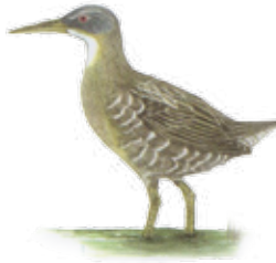
Rascón picudo Ridgway's rail Rallus obsoletus