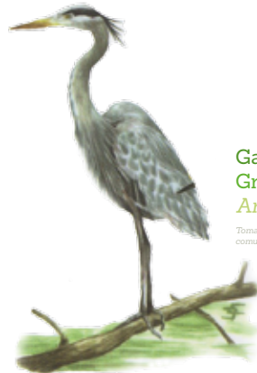
Garza azul Great blue heron Ardea herodias