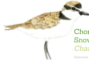
Chorlito nevado Snowy plover Charadrius nivosus