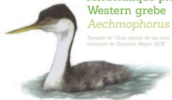
Achichilique pico-amarillo Western grebe Aechmophorus occidentalis