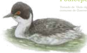
Zambullidor orejudo Eared grebe Podiceps nigricollis