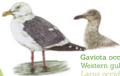
Gaviota occidental Western gull Larus occidentalis