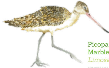
Picopando canelo Marbled godwit Limosa fedoa