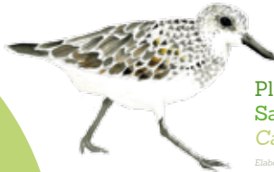
Playerito blanco Sanderling Calidris alba