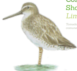
Costurero pico corto Short-billed dowitcher Limnodromus griseus