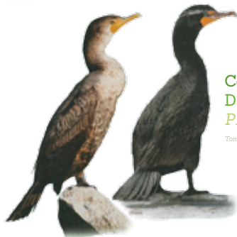
Cormorán orejudo Double-crested cormorant Phalacrocorax auritus